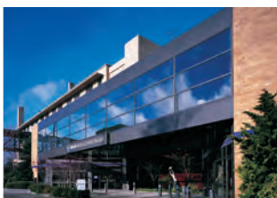
SWEDISH 巴拉德 (BALLARD) 院區