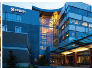
SWEDISH 伊瑟闊 (ISSAQUAH) 院區