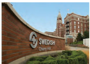
SWEDISH 櫻桃山 (CHERRY HILL) 院區